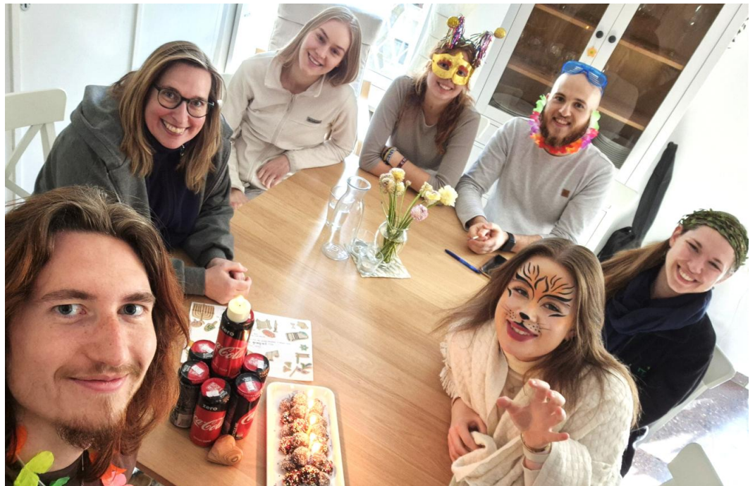
Purim-/Geburtsfeier im Krieg

Der Humor, mit dem sie die zermürbenden und manchmal auch nervigen Situationen auflockern. Das Gottvertrauen, mit dem sie ihre Zukunft in Gottes Hand legen.